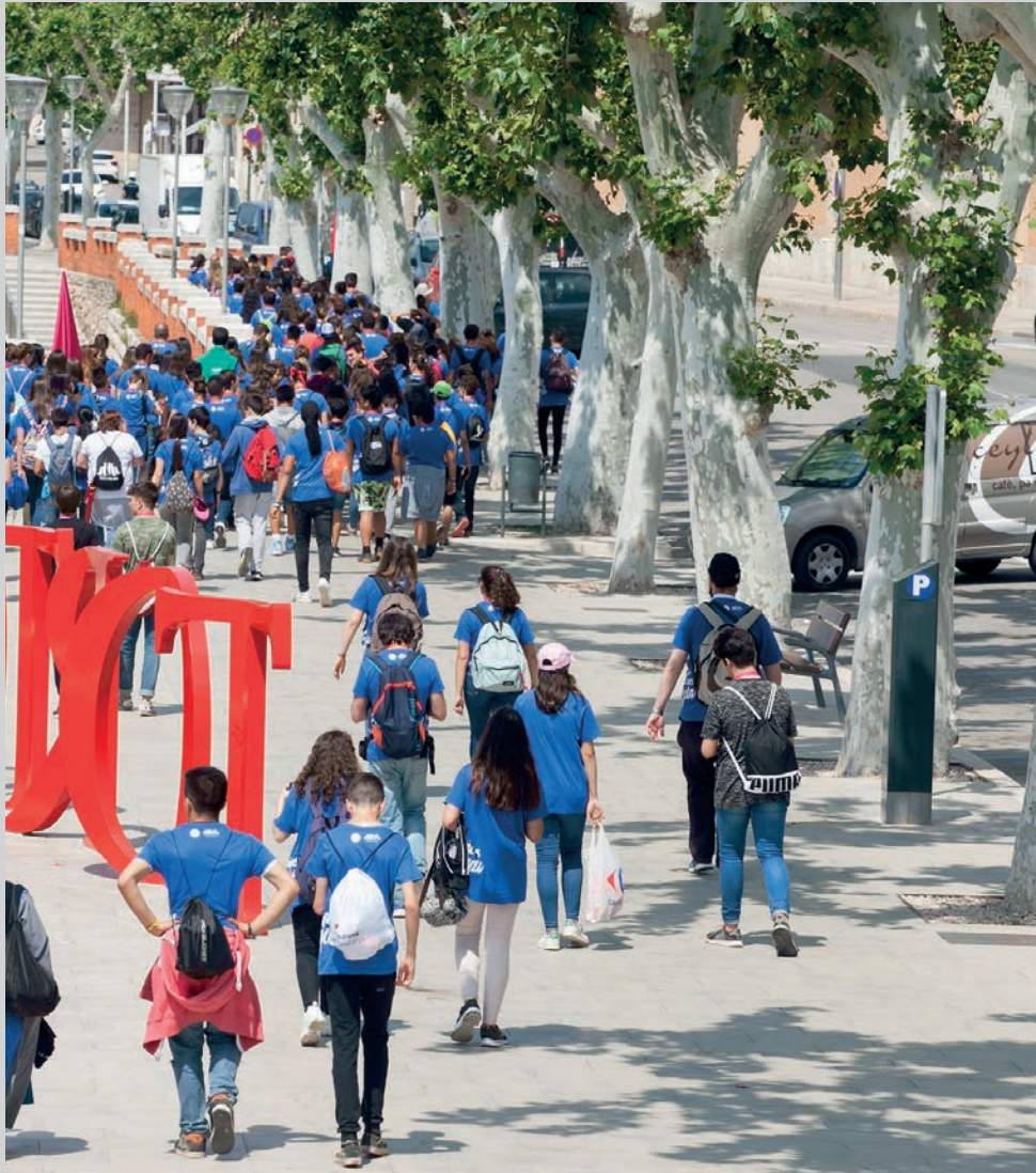
MCS Arquebisbat de Tarragona

Aplec de l'Esperit 2018 celebrat a Tortosa.