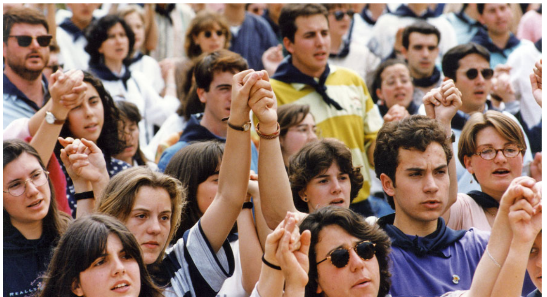
Un grup de joves participa a l'acte de cloenda del Concili Provincial Tarraconense, celebrat el 4 de juny de 1995

Contemplant els seus documents i resolucions, hom s'adona de la seva profunda actualitat. A la llum de l'Evangeli i de l'escolta de la Paraula de Déu, anunciar l'Evangeli a la nostra societat, amb una sol·licitud especial pels pobres, i en un marc d'unitat pastoral de les nostres Esglésies, ha de ser el pern o el pal de paller de l'Església d'avui.