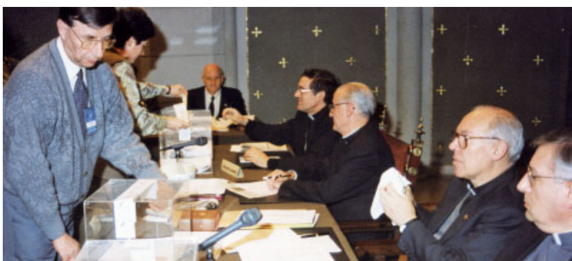
Obertura de les urnes després de les votacions dels temes