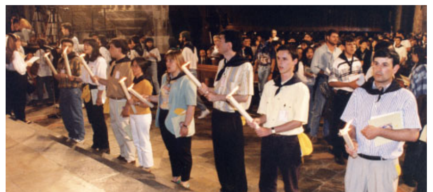
Moment de la cloenda del Concili a l'interior de la Catedral de Tarragona