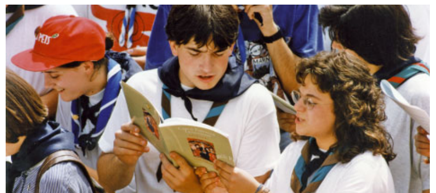
Joves participant en l'acte de cloenda del Concili a l'amfiteatre romà de Tarragona el dia 4 de juny de 1995