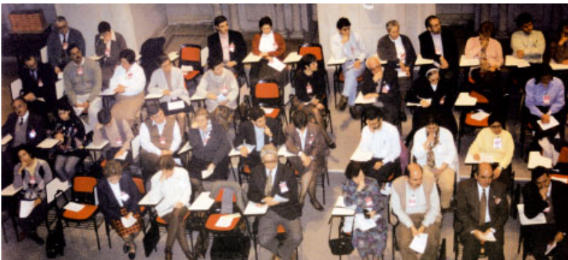
Sessions de treball al Casal Borja de Sant Cugat del Vallès