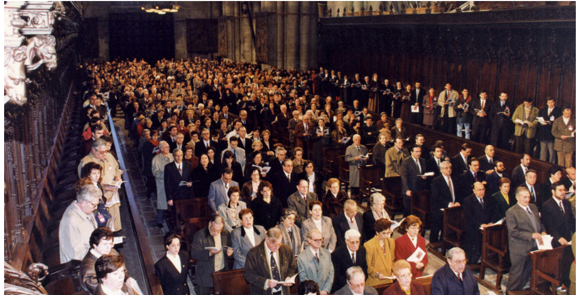
Imatge de la inauguració del Concili Provincial Tarraconense que va tenir lloc el 21 de gener de 1995, a la Catedral Basílica Metropolitana i Primada de Santa Tecla