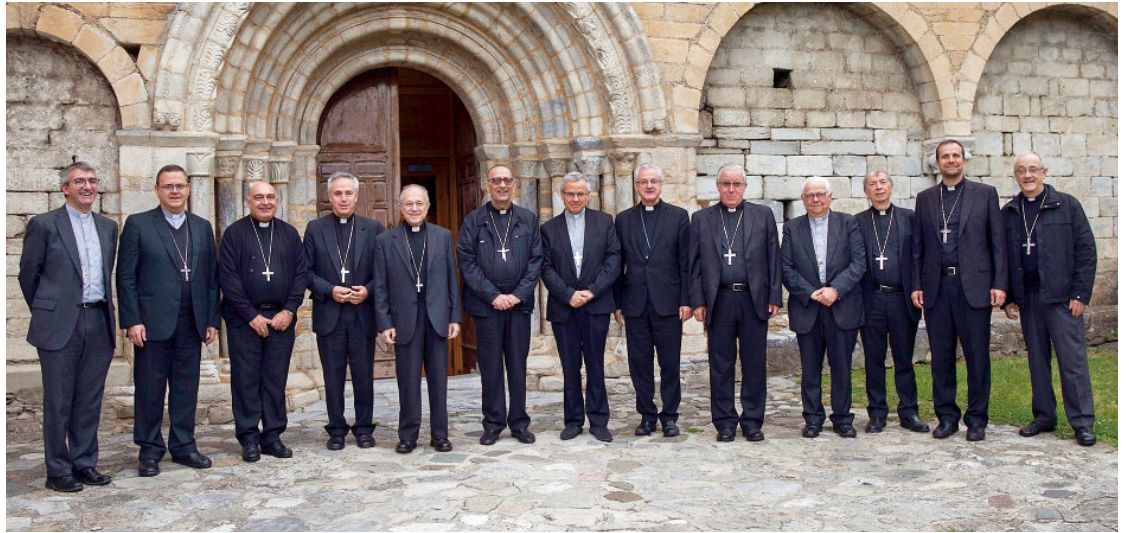
Els actuals bisbes de les diòcesis amb seu a Catalunya en una imatge de la reunió de la Tarraconense celebrada a Salardú, el passat mes de juliol

El concili fou clausurat solemnement a la catedral de Tarragona el 4 de juny de 1995. En