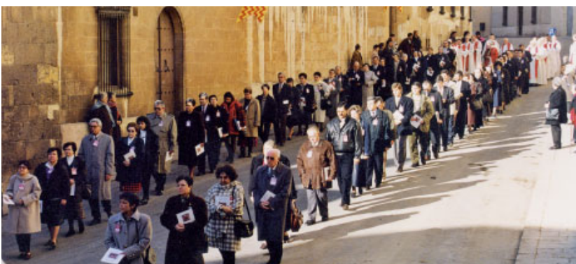
Processó pels carrers de Tarragona. La participació de laics va ser molt important i generosa